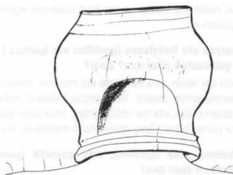
Larru-godaleten erabilpena (Gura elxeokak, 1935 ekkoak)

Usü agitzen zia(n) hura, lehen, haurretan erdi - gose - jan-kin beitziren, zernahi jaten edo batetan jatenegei beitzüen. Ordüan ez hüan hurik eman behar edatera nun ez zen erri (arroz) hura eta erri janerazten giniean. Horiekin oroekin zonbait aldiz ez zia(n) aski eta ez zia(n) oraiko erremedio bortitz horietarik.