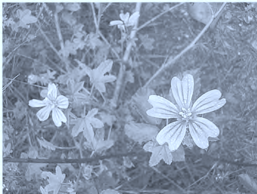
Fig. 7. Malvas.