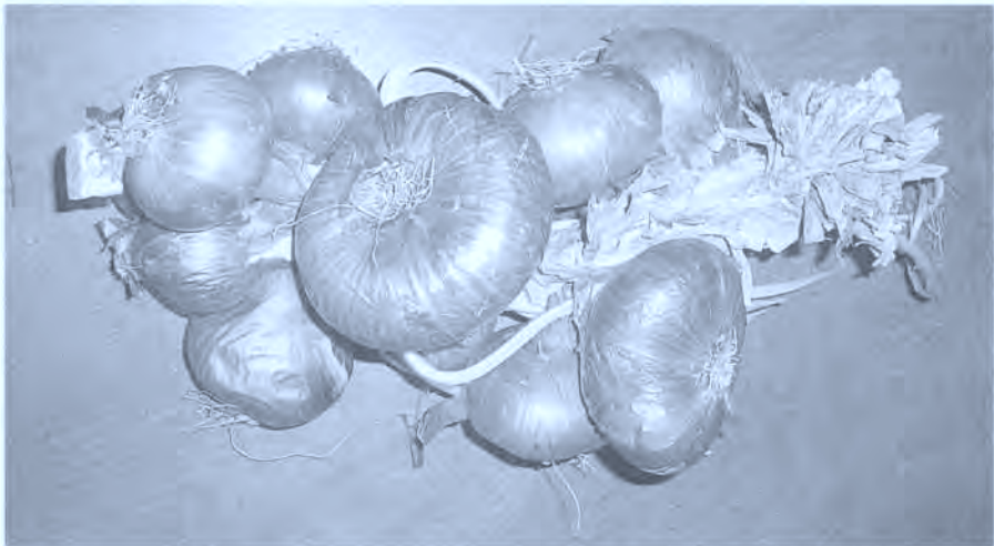
Fig. 9. Ristra de cebollas.

En abril de 1794 un perro rabioso mordió a otros de su especie, a caballeros y a personas. El Ayuntamiento envió a un propio al Monasterio de Leire en busca de un monje especializado en conjuros. Los gastos de venida e ida más el sueldo ascendieron a 24 reales fuertes. De nuevo en 1839 estuvo en el pueblo un lobo rabioso y vino a la ciudad Manuel Resa, exmonje de Leire, estaba ya el monasterio desamortizado, y cobró 40 reales por conjurar a las caballerías.