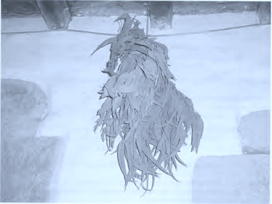
Fig. 3. Hojas secas de eucaliptus.

Para la curación del catarro se ha recurrido con frecuencia a los vahos de hojas de eucaliptus. Aún hoy se utiliza este remedio por algunas personas, que compran en la farmacia las hojas de dicho árbol.