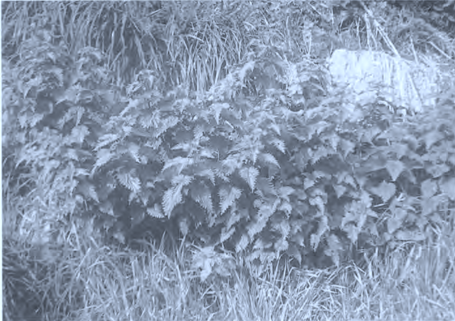
Fig. 4. Mata de ortigas.