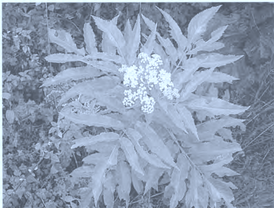
Fig. 1. Saúco.

Algodón, guata, vendas, agua oxigenada, yodo, aceite de ricino, linaza y mostaza, pera de goma o aparato para irrigaciones.