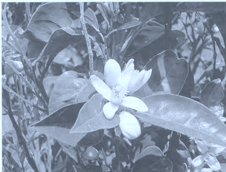
Fig. 2. Flor de naranjo.

Ingredientes : Hierba loca, romero, saúco, hojas de rosa, uvas de milano, balsamina, lapaza o lengua de perro, hiel de cerdo, cera virgen de abeja, vino tinto