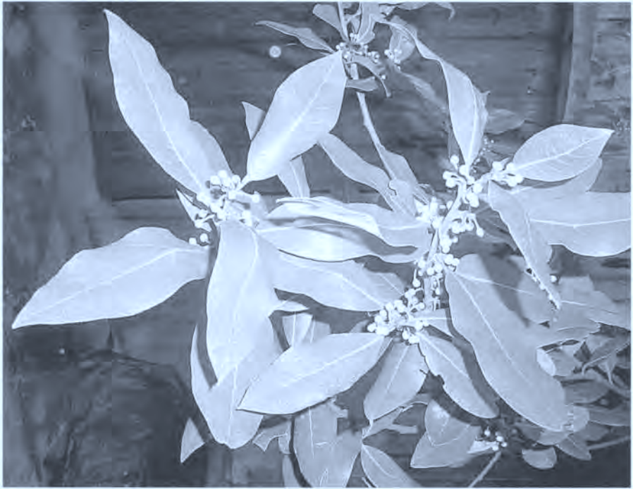
Fig. 8. Laurel.

Hace pocos años murió una persona que se aplicaba en la rodilla un hierro rusiente y obtenía muy buenos resultados, llamaba a la operación ponerse "botones de fuego".