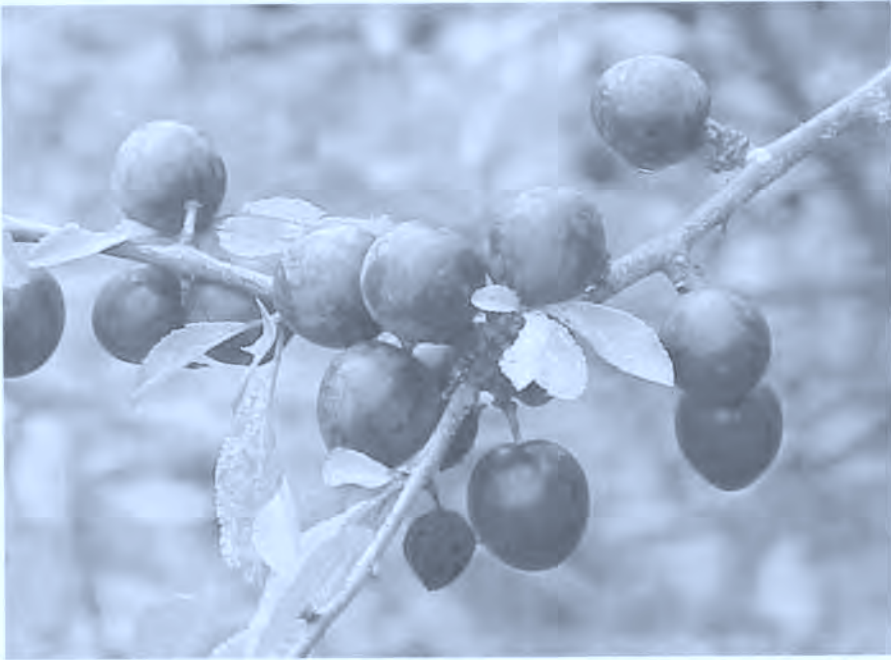
Elorri beltza, elorria (mazakana). Prunus spinosa . Endrino.