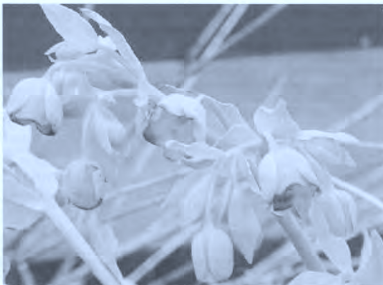
Helleborus foetidus. Eléboro fétido.