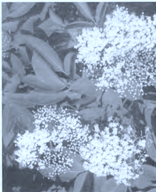
Intxusa. Sambucus nigra . Saúco.

* Makarrak. Kamamilua ( Matricaria chamomilla ) uraz garbitu .(7) (47, 48 ERRETERIA)