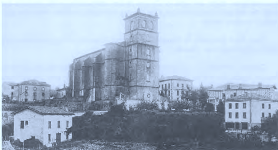
Parroquia de San Esteban.

Se encuentra a 60 metros de altitud y ha pasado de los 4.000 habitantes de que constaba en 1900 a los casi 10.000 que tiene en la actualidad.