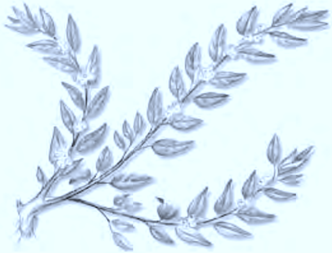
Pareta belarra. Gibel belarra. Parietaria officinalis . Parietaria