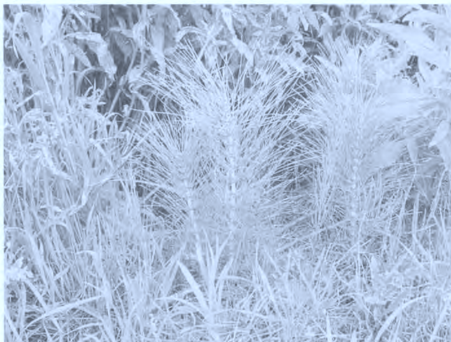
Azeri buztana. Equisetum telmateia . Cola de caballo.

* Giltzurdinetarako. Arobizarra, ur irakinda. (52)