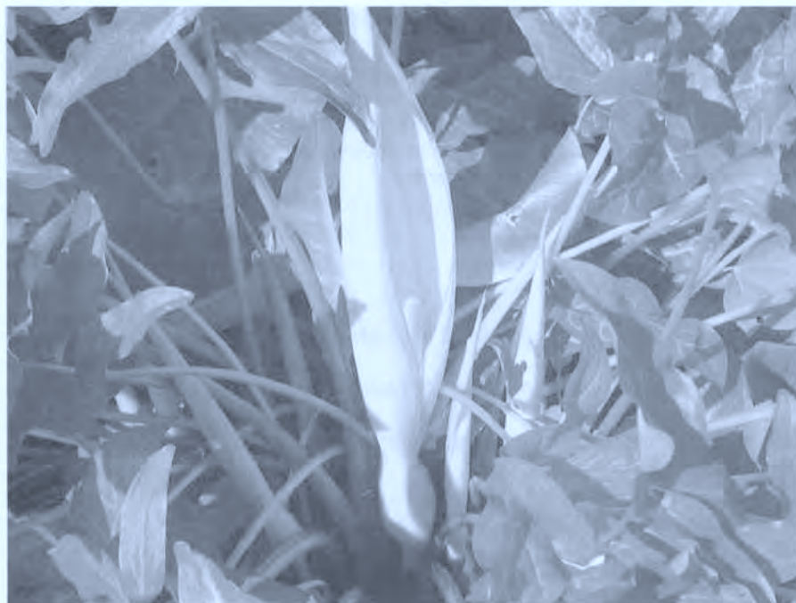
Arum italicum . Aro.

* Okendo Beltza: Olioa eta baratxuriak egosi (hamar buru). Irakitzen dagoe-nean argizari purua eta minio hautsa bota eta okendi honekin ebakia estali.(7)