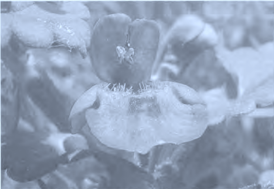
Xagu belarra (Se llama así por el olor que tiene). Glechoma hederacea . Hiedra terrestre.

* Para un tipo de eccema se decía que se solía tomar sagu belarra . Con la leche la planta.(5)