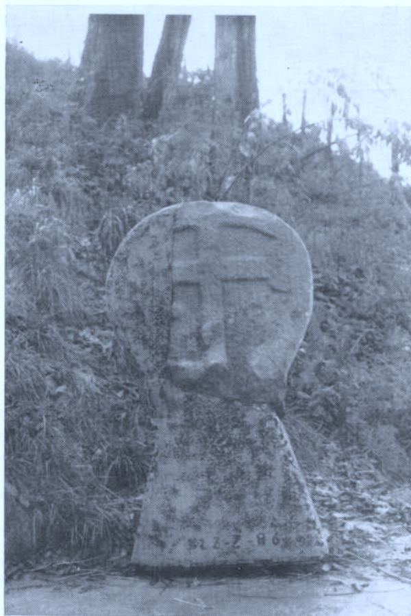
Foto 2. — La estela de Astigarraga al reverso tiene perfectamente marcada una cruz latina.