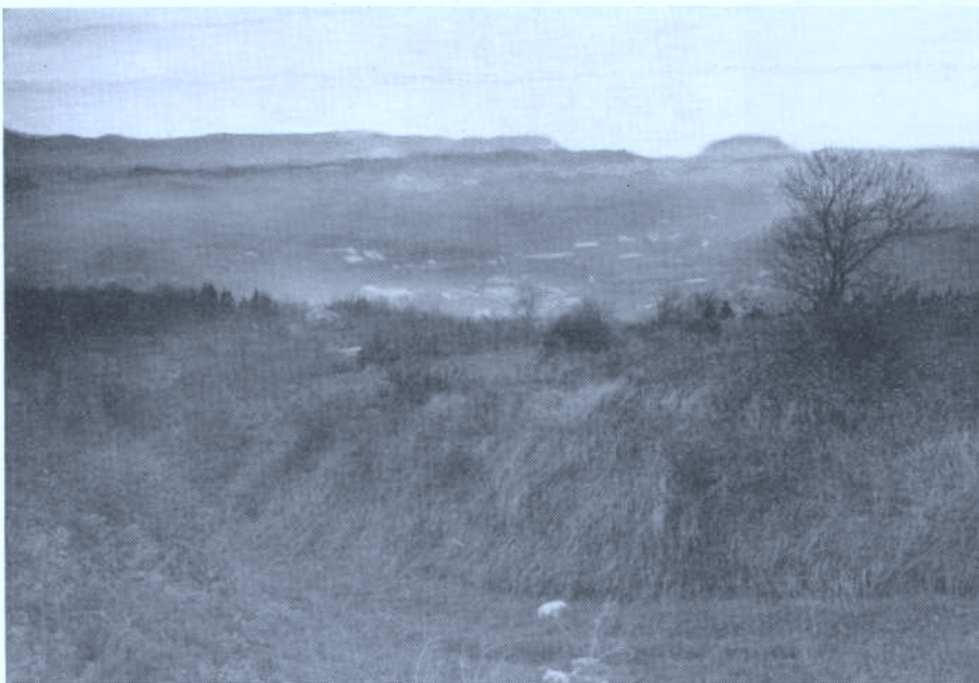
Foto 4. — Vista del camino y de la vega desde las cercanías de la ermita de Santigomendi. (A.A. 14-XII-86)