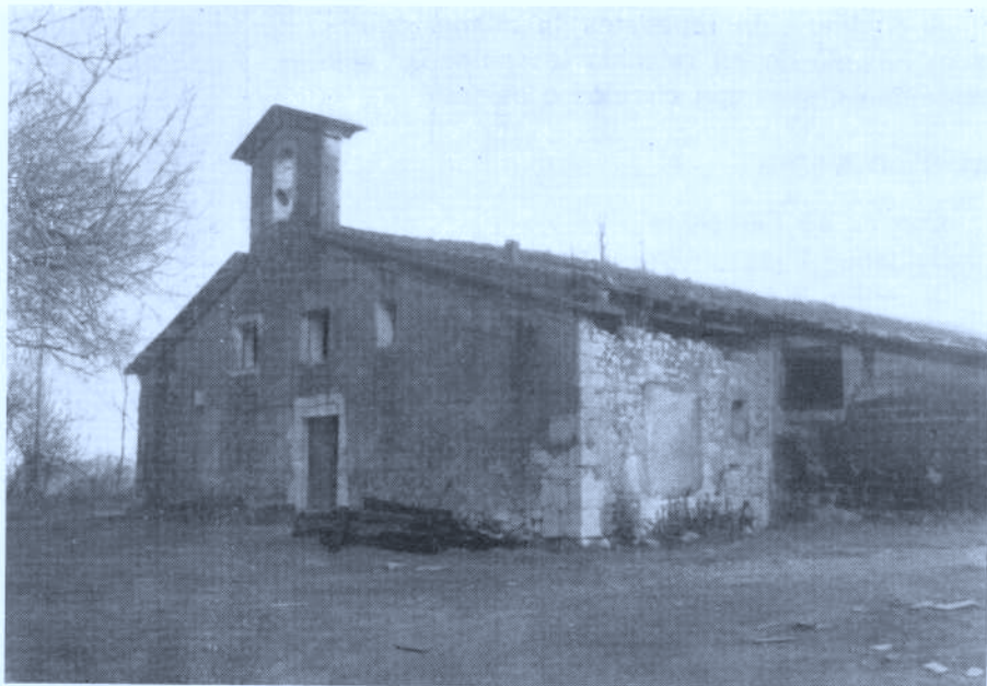
Foto 5. — Estado actual de la ermita de Santiagomendi. (A.A. 14-XII-86)