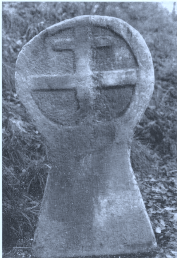
Foto 1. — La estela de Astigarraga restaurada, presentando en una de sus caras el dibujo de una cruz patriarcal. (A.A. 14-XII-86).

Por otra parte, desarrollando la teoría planteada por Manso de Zúñiga según la cual muchas estelas presentaban en sus caras los mismos dibujos que las monedas en circulación durante la época en que la estela fue tallada (5), los resultados que se desprenden se inscriben en el mismo período mencionado por los autores anteriores.