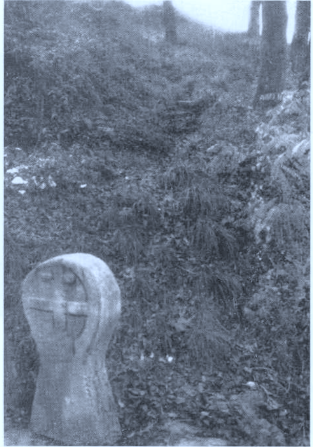
Foto 3. — Inicio del viejo camino de subida a Santigomendi, en las puertas del caserío Mikelenea. (A.A. 14-XII-86)

Como se comprenderá, no hemos encontrado ninguna pieza con cruces en ambas caras —como la estela de Astigarraga—, pues las monedas históricamente se han acuñado con la cruz en uno de los lados y en el otro el escudo, el rostro o cualquier signo representativo del reino al que pertenecían.