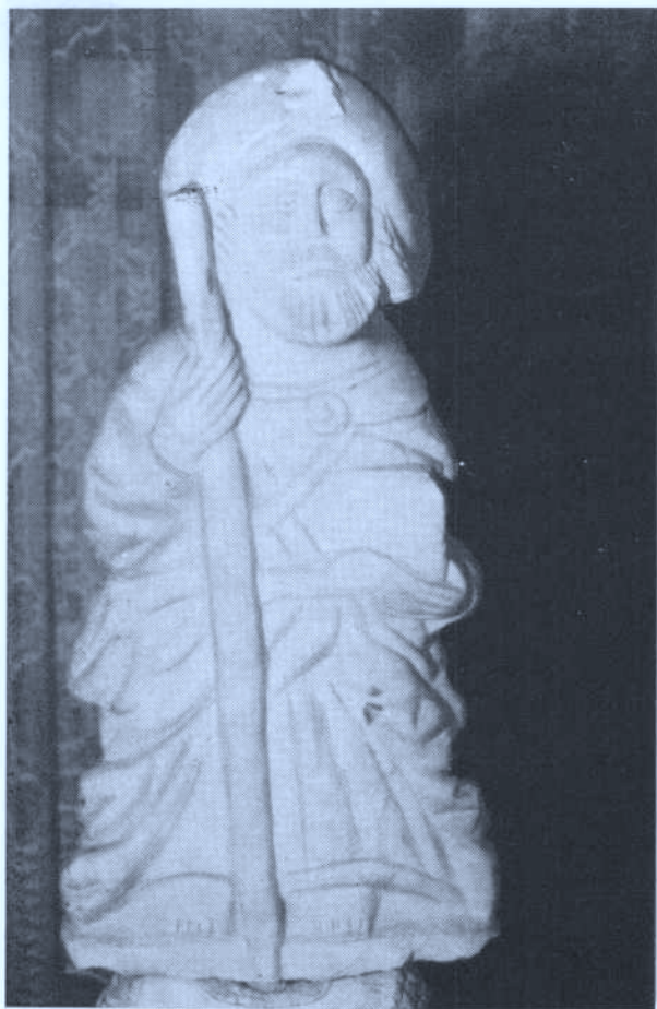
Foto 6. — Imagen de Santiago (siglo XIII) que se conservaba en el interior de Santiagomendi. (A.A. 14-XII-86)

Veamos ahora en qué casos se acuñaron tanto la cruz patriarcal como la cruz con círculos o esferas: