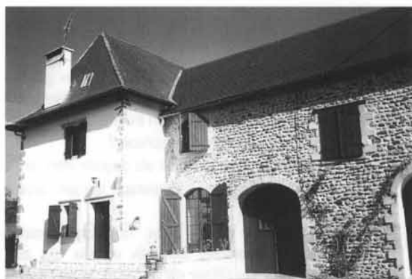
Inchauspe jaunaren etxea, XVI-XVII.mendean Leizarragaren laguntzaile eta jarraitzaile "higanaut" etxea izana.

Gizon honek fabrika batean lan egiten baitu Maule albo-ko Onizen, arratseko bitatik hamarretaraino deitu nion eta han goizeko bederatzitan egoteko ordua hitz hartu genuen.