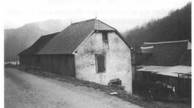
"Dordorrage" Joanes CARRICABURUren etxea Ligin.