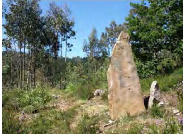
Figuras 7 y 8. Muralla del Castro de Arrola (Arratzu). Monolito de Zurbituaga (Busturia)

Ya en la Edad de Hierro, se va a concentrar en construcciones defensivas o poblados fortificados con anchas murallas de piedra construidos en cimas y lugares elevados junto a vías naturales desde donde se divisan las entradas a la comarca tanto por tierra como por mar, formando lo que conocemos como castros, como los de las cimas de Iluntzar (Nabarniz), Arrola-Maruezea (Arratzu-Nabarniz) o Kosnoaga (Gernika-Errigoiti).