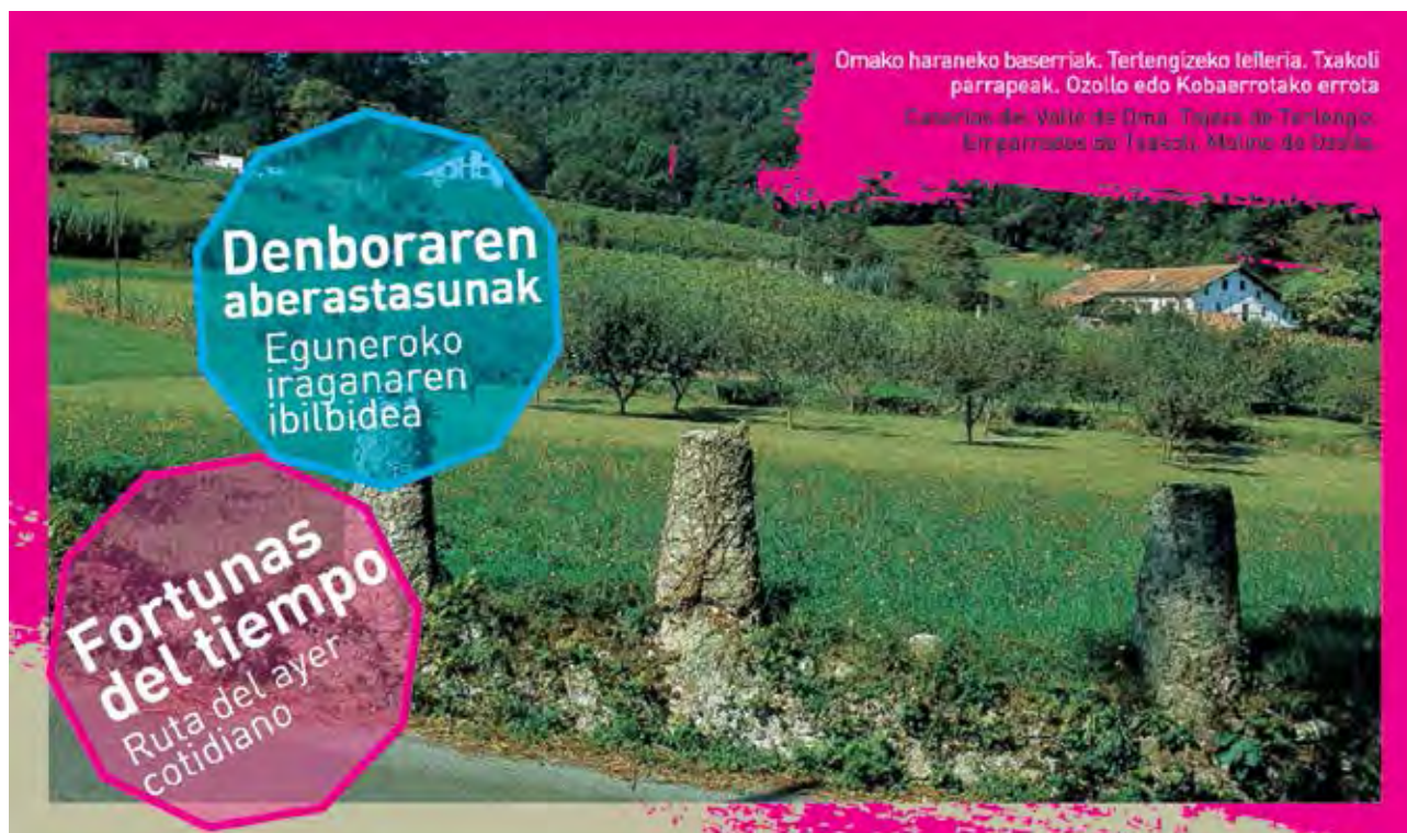
Figura 51. Imagen del tríptico promocional de las rutas de patrimonio cultural en Busturialdea. Ruta del ayer cotidiano.

¡Descubrelo! , lanzada por el Departamento de Cultura del Gobierno Vasco a través de la oficina de turismo de Busturialdea, en la temporada estival del 2011 119 . Cinco rutas cuyos títulos son: 1) piedras preciosas, 2) joyas arquitectónicas, 3) secretos enterrados, 4) fortunas del tiempo, 5) tesoros sagrados.