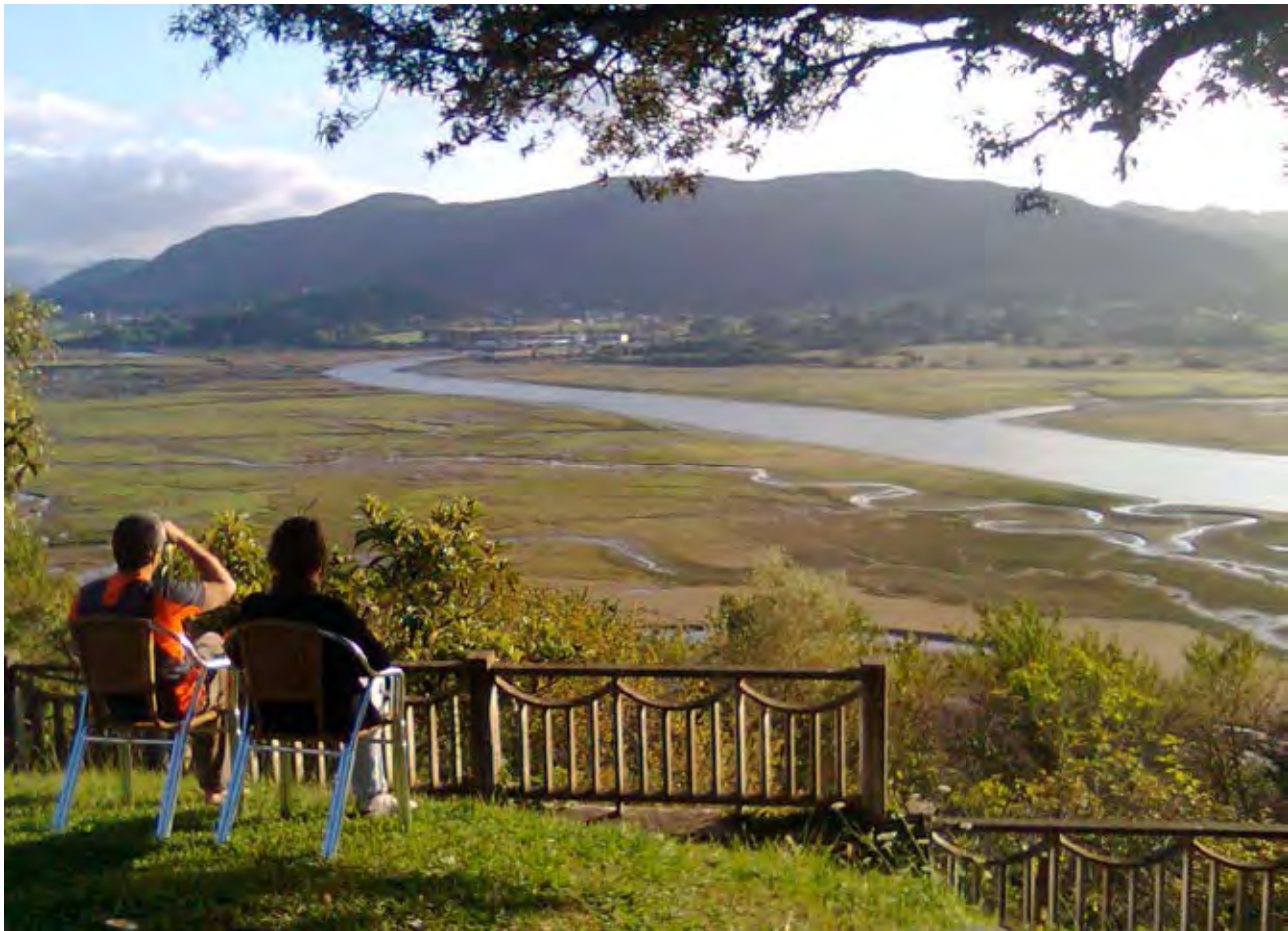
Figura 56. Mirando el paisaje en Kanala.

vivenciales, sobre los que crear una imagen o narración determinada, al tiempo que se propone una imagen identitaria a los habitantes locales. Naturaleza, ocio y tradición cultural son los recursos de la nueva economía. Los pueblos se transmutan en espacios museológicos, y sus tradiciones en bienes consumibles. Y los paisajes, sus habitantes y su cultura en productos patrimoniales y recursos turísticos.