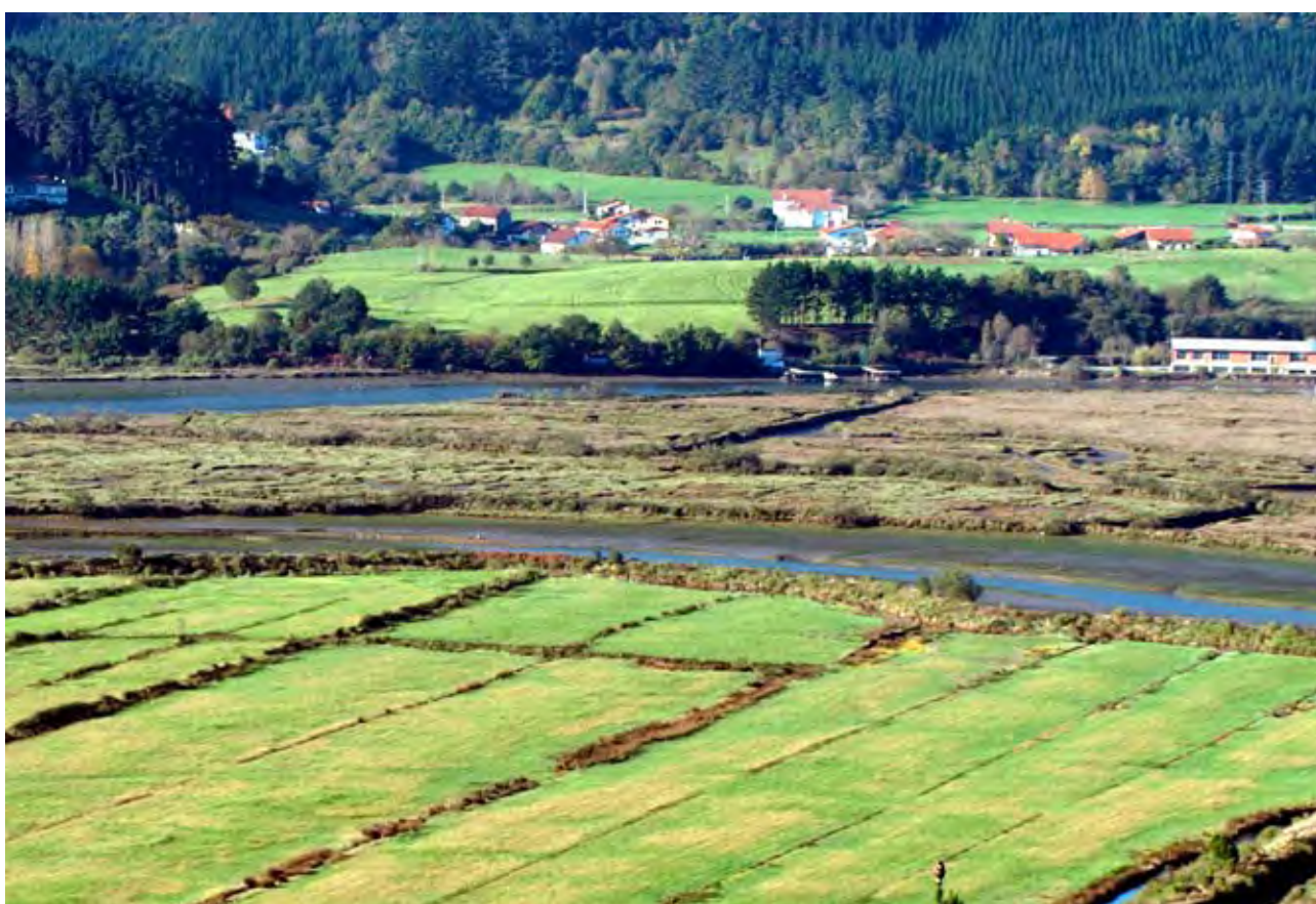
Figuras 38 y 39. Juncuales, polders o ihitzak de Anbeko, frente a la tejera (izq.) y al astillero de Murueta (dch.). Abajo detalle de las ihitzak de Anbeko.

retería. La ría ha sido históricamente vía de comunicación y de transporte de mercancías: sal, carbón, hierro, leña, piedra, yeso, ladrillo.