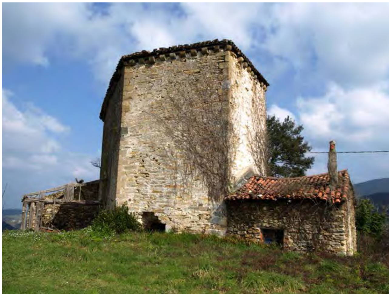
Figura 15. Casa Torre Montalbán (Mendata).

Puede parecer que la dispersión ha sido la forma primaria de ocupación del suelo en un tipo de organización que ha llegado hasta nuestros días. Sin embargo, ni el grado de intensidad en la ocupación del suelo, ni el tipo de dispersión en que ha cristalizado, son tan antiguos según se deduce de los conocimientos aportados por los historiadores. Esta organización es el resultado de una larga