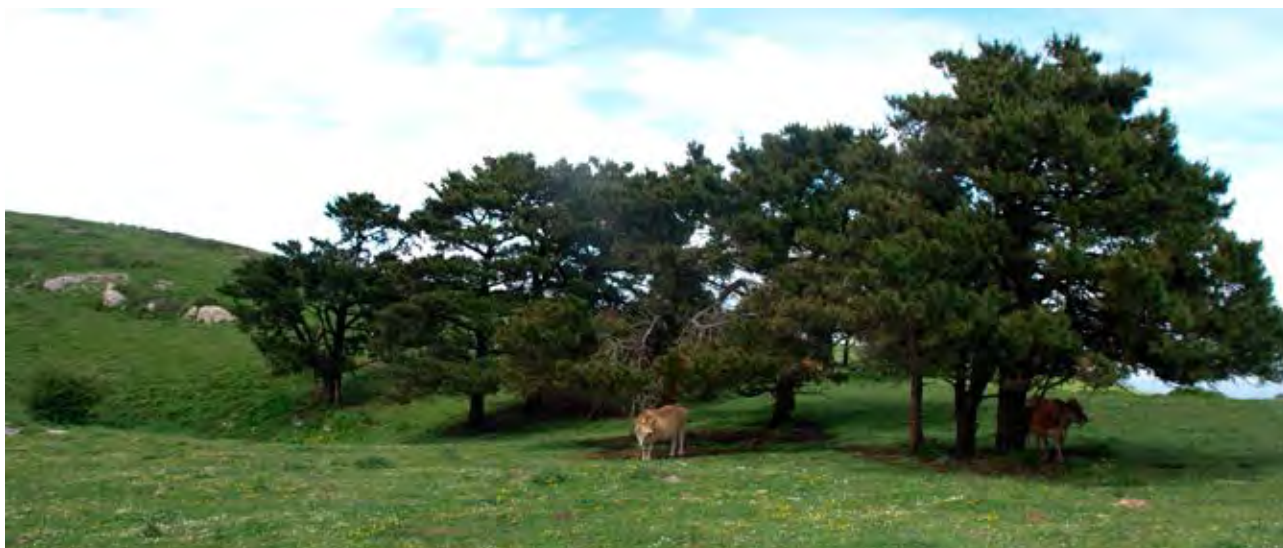
Figura 30. Majada de Potrollokorta en Iluntzar (Nabarniz).

plantaciones, aunque se sigue plantando por su rentabilidad a corto plazo, en detrimento del equilibrio ecológico.