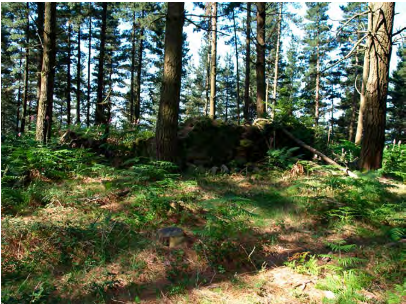
Figura 32. Ruinas de txabola en Olaxeria (Muxika).