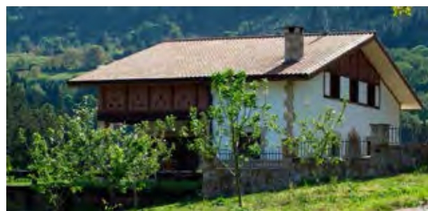
Figuras 21 y 22. Nuevas construcciones residenciales tipo caserío.