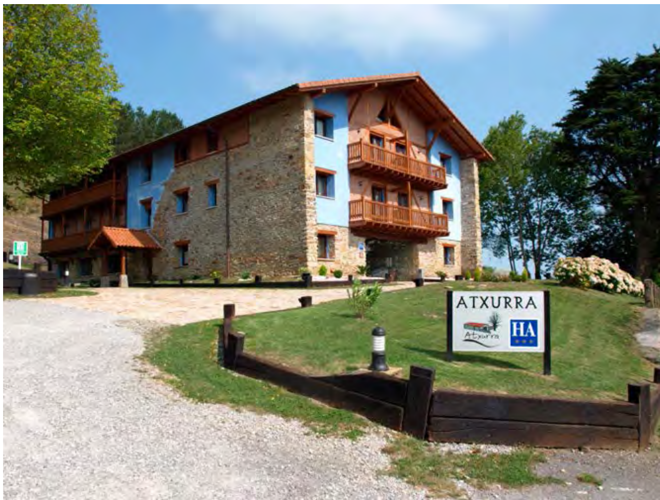
Figura 19. Hotel apartamento rural Atxurra (Sollube-Bermeo)

momentu baten, ekonomia lokalak erakusten dau zelako grabetkoa dan 44 .