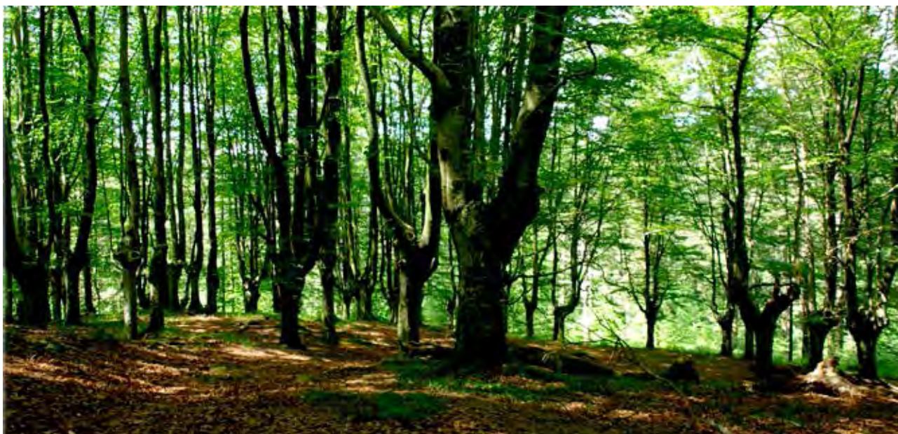
Figura 26. Hayedo de Airo o Aziro, en Nabarniz.

sos regulares a corto plazo. Se trasmochaban los hayas cuando tenían unos 50 años. Se cortaba la guía principal, y junto a la zona del corte el árbol producía una serie de ramas que luego se cortaban cada quince o veinte años aproximadamente. Esa madera iba destinada para la obtención de carbón vegetal que luego era empleado en la metalurgia de las ferrerías. Los troncos, bravos o derechos, de unas medidas y formas específicas, eran transportados para la carpintería naval a los astilleros.