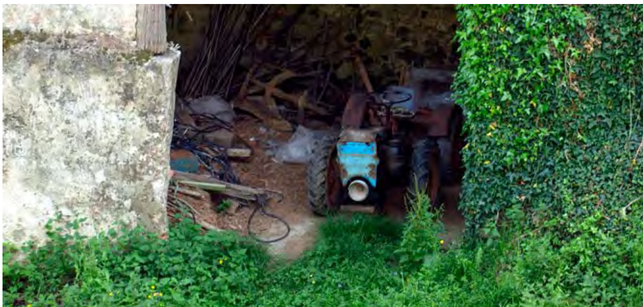
Figura 17. Tractor en caserío de Murueta.

nuevo auge a la agricultura tradicional provoca su decadencia. La economía rural tradicional tiende a la homogeneización de usos, y el paisaje se homogeniza bajo la omnipresencia del pino, se crean las vegas industriales, e importantes viales de comunicación (carreteras, ferrocarriles), y los asentamientos urbanos crecen notablemente.