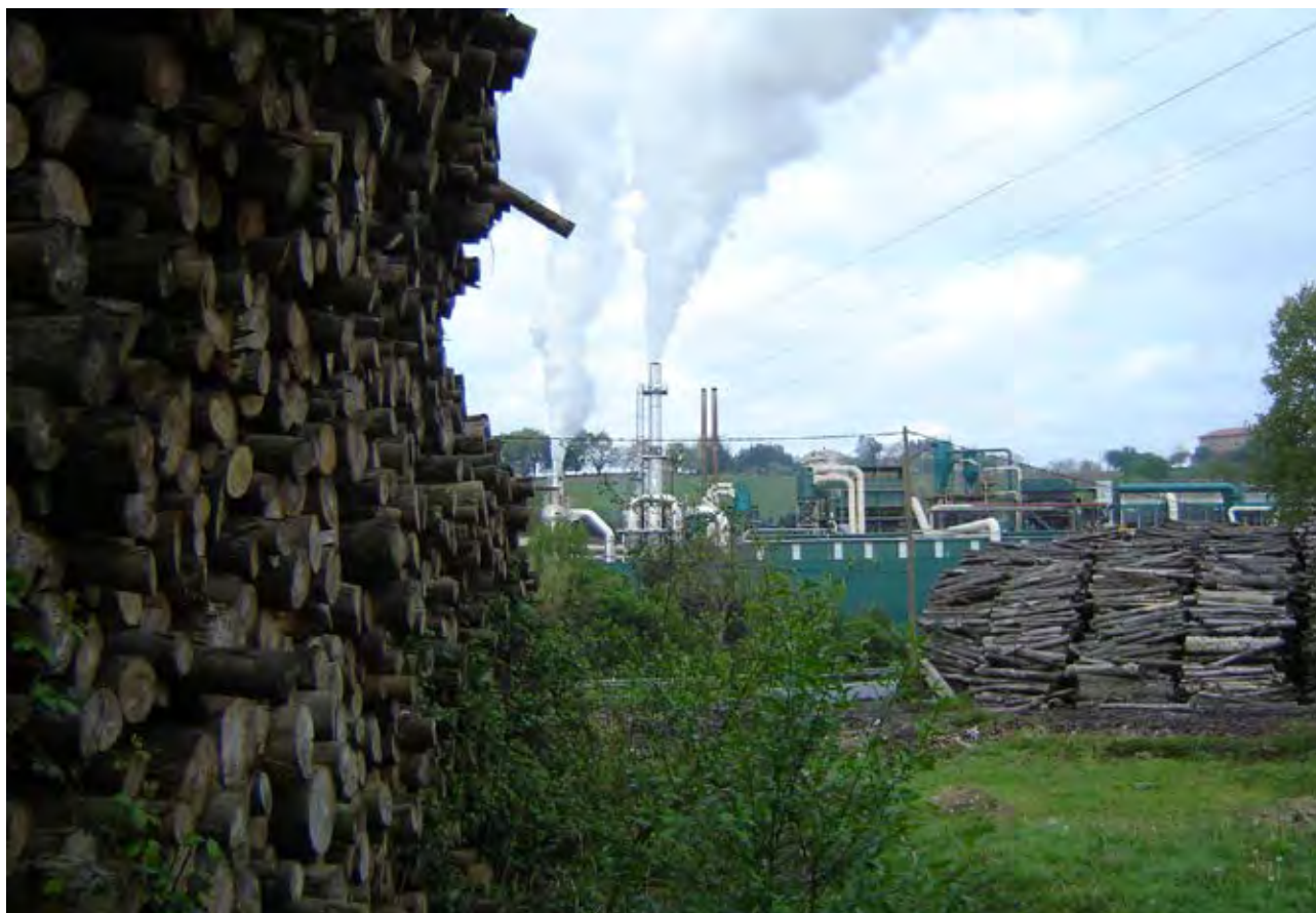
Figura 35. Aserradero y fábrica maderera Inama en Muxika.

En el otro extremo está el jardín, como paisaje cultural creado para el disfrute y recreo de unas élites (Müllauer-Seichter 2003). O las prácticas urbanísticas y de esculturización del paisaje de la costa: peine de los vientos, el Museo Guggenheim, los Cubos del Kursaal; una dinámica que ha proliferado en las últimas décadas (Vivas Ziarrusta & Arnaiz Gómez 2007), y de la que hay numerosos ejemplos en la costa de Busturialdea 95 .