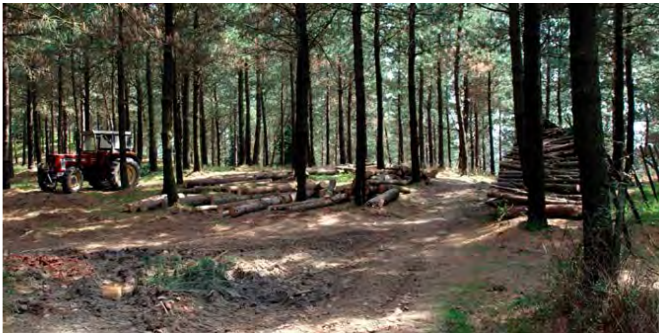
Figura 28. Explotación de pino en Maume, Oiz (Muxika).

En este panorama, el paso de los montes comunales a la propiedad privada no se lleva a cabo por la simple ocupación por parte de los campesinos. Su apropiación se insertó en el proceso general de desamortización que en esta región, además de importante fue temprano. Por ejemplo, en Ereño el proceso de privatización alcanza su punto culminante en 1810 y 1812 con la solicitud al Consejo Provincial que se autoriza a proceder a la enajenación de todas las tierras y montes concejiles o comunales justificando esta solicitud porque, la experiencia enseña que las propiedades comunes no son tan bien cultivadas como las particulares, y que las rentas del patrimonio público solo sirven para fomentar pleitos (Etxabe 1996: 141).