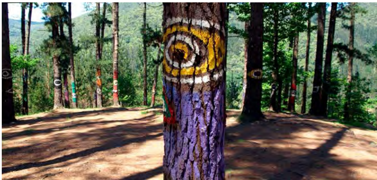
Figura 13. Ojos pintados por Ibarrola en el pinar de Oma, como una mirada interlocutora de la naturaleza.

una dificultad metodológica obvia, en cuanto que las representaciones pertenecerán a momentos históricos diversos, tradiciones pictóricas distintas, a sociologías diversas, en definitiva, a diferentes momentos culturales.