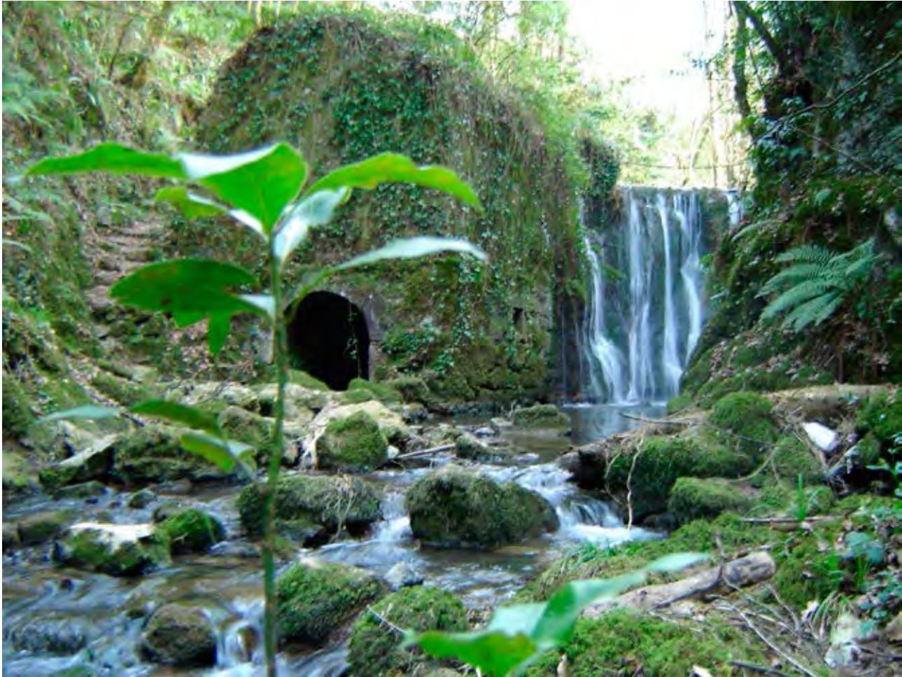
Figura 25. Restos del Molino de Bolinzulo. Oma.

por talas y continuos cortes que generaron la necesidad de plantaciones y el trasmochado o corte por la cepa o copa de robles y castaños. La propia funcionalidad del monte había originado una silvicultura racional, que se traducían en un monte cultivado y repoblado, cuya finalidad era responder a la demanda de combustible de una industria siderúrgica primaria (Gogeoascoechea, en Meaza et al. 2004: 18).