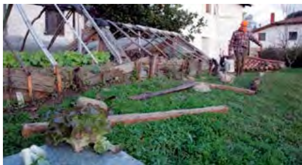
Figura 4. En el invernadero. Enderika, Kortezubi.

En este sentido apunta la idea de los paisajes producto de las labores cotidianas ( taskscape ) propuesta por Tim Ingold (1993), con la que se refiere a los actos cotidianos que producen el carácter de cualquier paisaje, y que constituyen la clave para conseguir