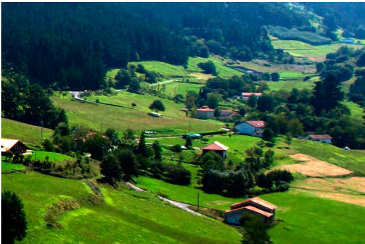
Figura 14. Caseríos dispersos en Ereño-Bollar.

Este paisaje de campiña, considerado como el tradicional paisaje agrícola vasco, con su poblamiento disperso y el mosaico de policultivos, praderas y repoblaciones, es el resultado de un proceso histórico de transformación intencionada de los antiguos paisajes