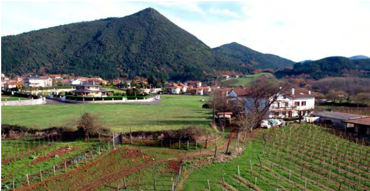
Figura 20. Chalet con vallado frente a caserío en la vega de Arteaga.

formas de vida más cercanas a las de la ciudad que a las del campo. Y por último, la ruralidad densa característica de las periferias urbanas.