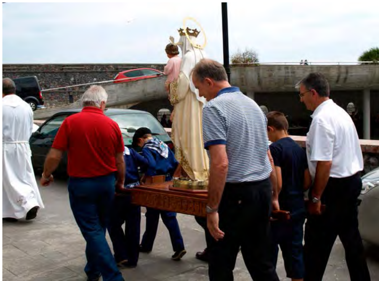
Figura 46. Procesión del día del Carmen (Elantxobe).