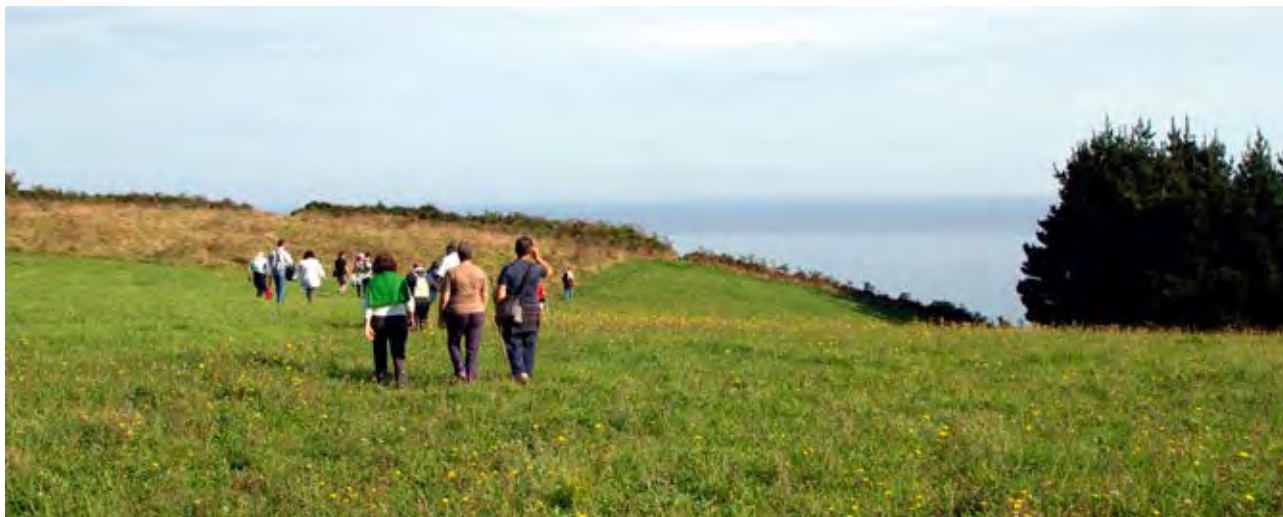
Figura 55. Hacia el paisaje cultural de la sostenibilidad.

espacio construido, que genera una fragmentación de la lógica territorial y paisajística preocupante, y que se traduce en unos paisajes mediocres, dominados por la homogeneización, la repetición, la clonación, la artificialización, la tematización, la festivalización, la banalización, la uniformización, insensibles y llenos de inautenticidad.