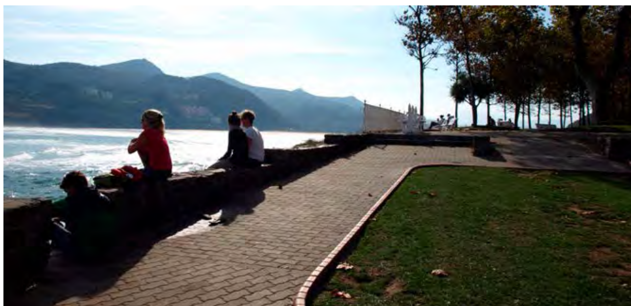
Figura 2. Mirando el paisaje en Mundaka.

Pero la percepción de un paisaje contemplado no será completa si no abarca el componente de la acción humana que lo ha conformado, lenta y sostenidamente durante siglos quizá, o en irrupción violenta otras veces. El paisaje entonces aparece como una realidad objetiva ligada a la realidad física del territorio que incluye los aspectos físicos, pero también los humanos y las mutuas incidencias de los unos en los otros. Las infraestructuras que el ser humano levanta, los topónimos que establece, las distintas estrategias ganaderas que ensaya, los acuerdos de convivencia que alcanza, los patrones constructivos que aplica, son resultado de intentar conciliar el paisaje mental y el físico, intervenciones, tangibles e intangibles con las que el ser humano construye paisaje.