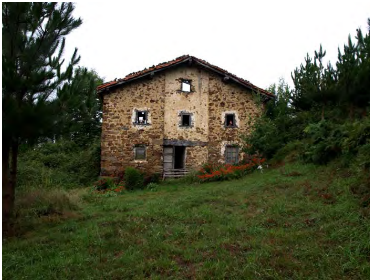
Figura 18. Ruinas del caserío Orbeleun entre pinos (Gastiburu, Mendata).

económica y su orientación técnico-económica, a una escala territorial, comarcal.