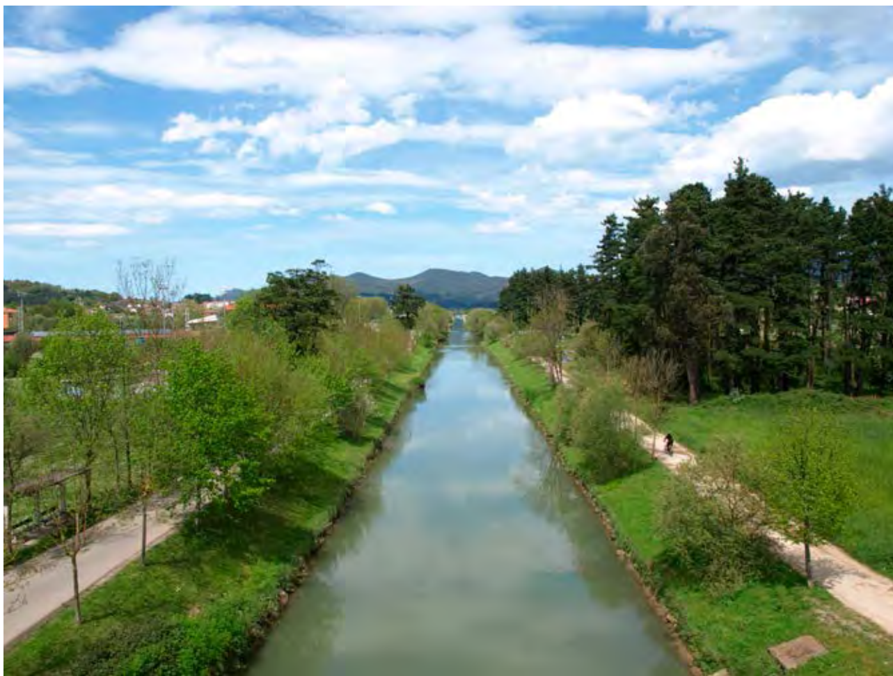
Figura 42. Erreka izkina o el corte de la ría visto desde Gernika.

ción del ferrocarril entre Gernika y Sukarrieta-Pedernales, por el ingeniero E. Hoffmeyer.