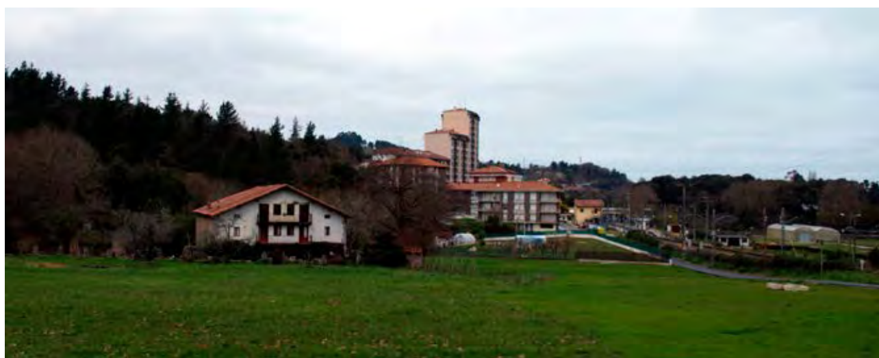
Figura 34. Caserío y el rascacielos de Lecumberri en Sukarrieta.