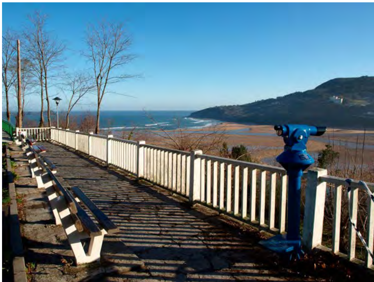
Figura 11. Mirador de Portuondo.

Aaron Guriévich refiriéndose al cronotopo medieval ya apuntaba que el espacio y el tiempo no solo existen objetivamente sino que también son vividos y percibidos subjetivamente por los hombres; y que además, estas categorías son interpretadas y aplicadas de manera distinta en las diferentes civilizaciones y sociedades, en los diferentes niveles de desarrollo social, en las diferentes capas de una misma sociedad e incluso según los individuos (1990: 52).