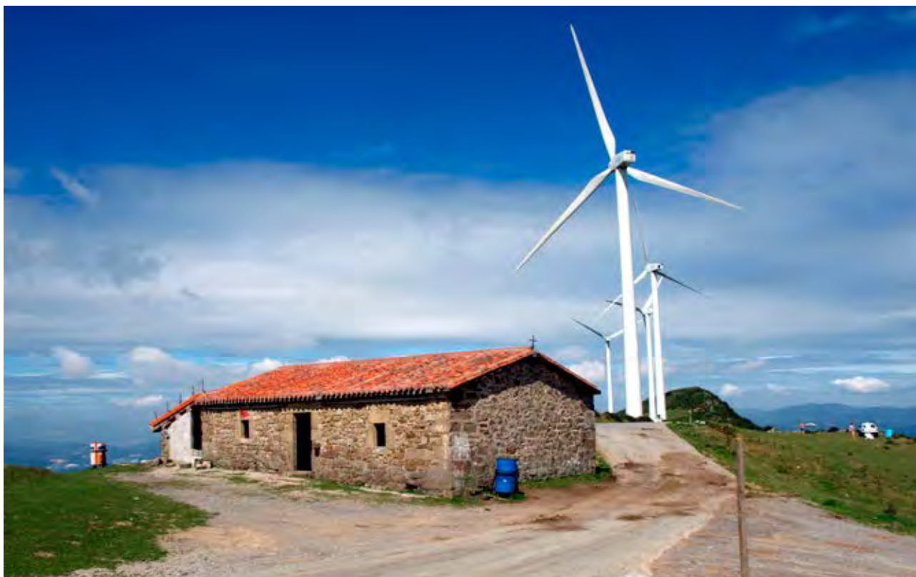
Figura 33. Ermita de San Cristobal y parque eólico en Oiz.

la mano de los procesos de industrialización y urbanización que han supuesto una intensa y acelerada transformación del territorio.