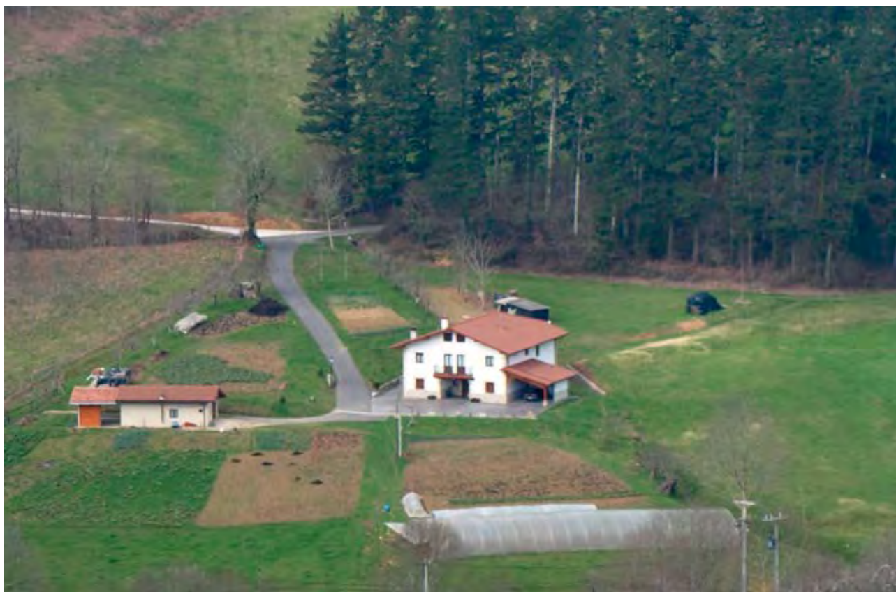
Figura 16. Caserío-baserri Olanar (Mendata).

Desde el punto de vista antropológico el caserío o baserri ha sido la unidad mínima de organización social con base territorial, formada por un conjunto de elementos: 1) un hábitat o residencia con sus aledaños (huerta, capilla); 2) el grupo doméstico (familia troncal); 3) las tierras de trabajo y su extensión comunal; 4) la tumba en la iglesia (sepulture y yarleku); 5) los derechos y servidumbres vecinales de la casa, 6) la identificación social y 7) los derechos políticos.