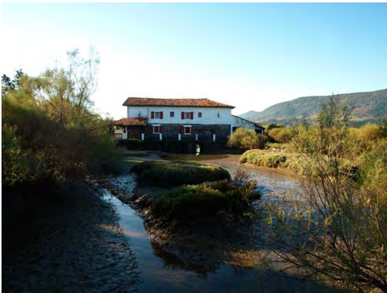
Foto 37. Molino de mareas en Ozollo, Arteaga.

Fuero de Vizcaya obligaba al usufructuario a cerrar sólo con seto y a colocar en el cerramiento tres puertas para abrirlas una vez recogida la cosecha, y que entrara libremente el ganado.