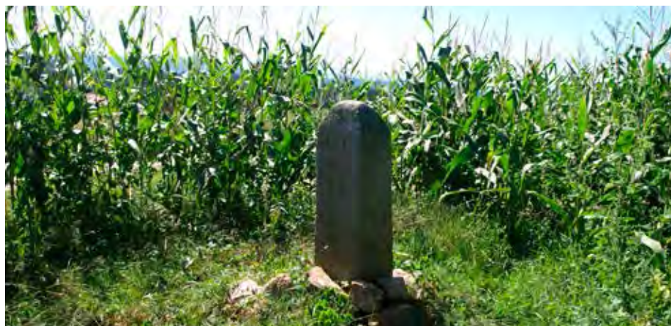
Figuras 9 y 10. Maíz, alubias y pimientos en etarte del caserío (Almike, Bermeo). Maizal en el sel de Makoleta (Paresi, Arrieta).

suelo para que produjese más intensivamente y algunos campos de mijo y trigo, se fueron paulatinamente sustituyendo por los de patata y alubia. Los nabos, que a pesar de que empezaban ya a ser una planta forrajera desempeñaban un papel en la alimentación humana, sucedían en invierno al maíz, y el lino que era la planta textil de la economía doméstica rotaba con el trigo.