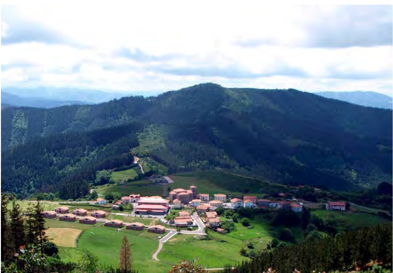
Figuras 23 y 24. Construcciones adosadas en los núcleos rurales de Nabarniz y Kortezubi.