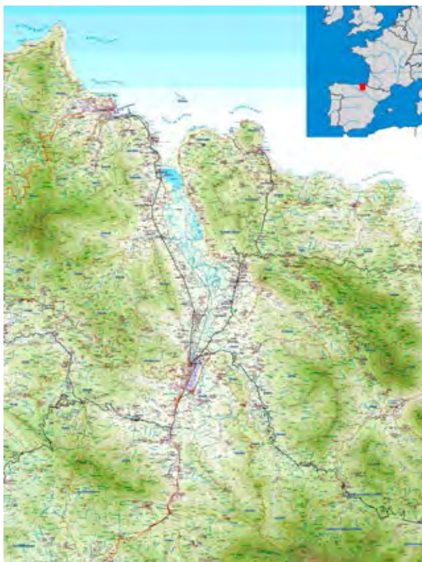
Figura 5. Ubicación y cartografía de la comarca de Busturialdea.

Abarca aproximadamente 230 km 2 , y administrativamente está conformada por veinte términos municipales 18 , dentro de los cuáles los núcleos más relevantes son Gernika-Lumo (16.812 habitantes) y Bermeo (17.144 habitantes), que acogen el 80% de la población de la comarca. En total alberga a una población estable que no supera los 50.000 habitantes 19 .