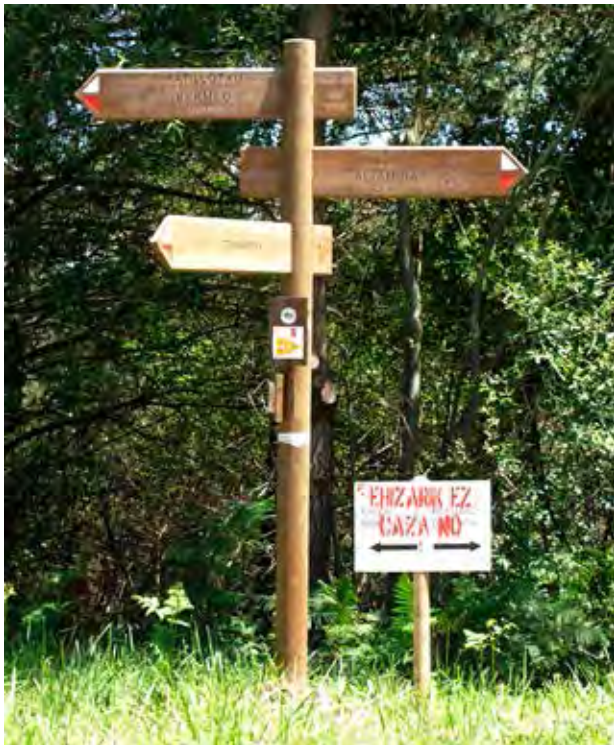
Figura 31. Señalización de senderos, y recorridos en bici BTT. Cartel de ¡Ehizarik ez-Caza no! (Busturia).

del XVIII, replantado con pinos en el siglo XX, y convertido en la actualidad en un paisaje de pastos y huertas de calidad estética 62 .