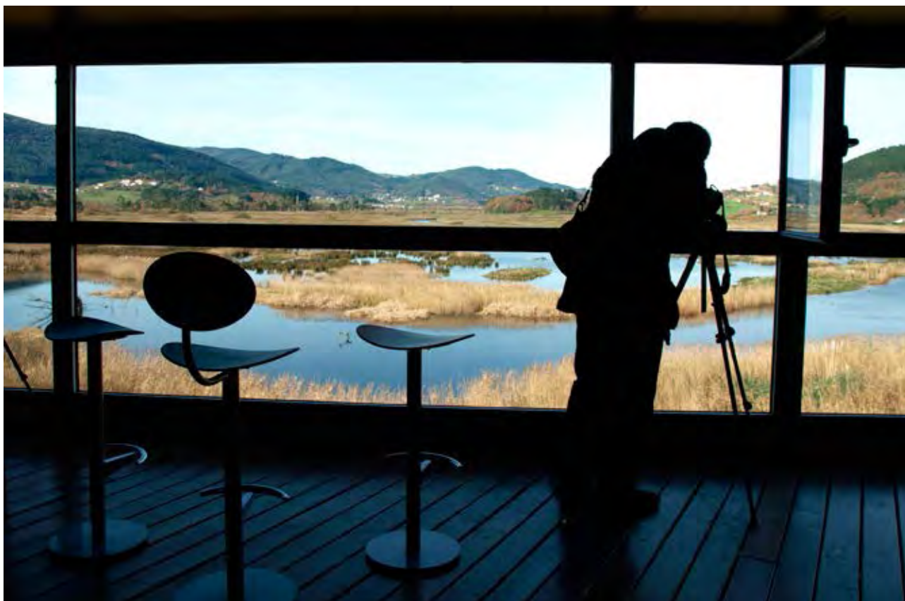
Figura 52. Mirador de aves sobre la marisma en el Bird Center de Arteaga.

En la búsqueda de un paisaje deseado que se vaya acercando hacia ese concepto de natural, gran parte de la marisma ocupada en los años de la postguerra del siglo pasado para tareas agrícolas y ganaderas, con pastizales y cultivos de cereal (1959) está en la actualidad asilvestrada. En los testimonios de los informantes se refleja la distancia entre este modelo de paisaje propuesto desde lo institucional, el paisaje percibido, y el paisaje deseado por los vecinos locales, el paisaje del pasado: