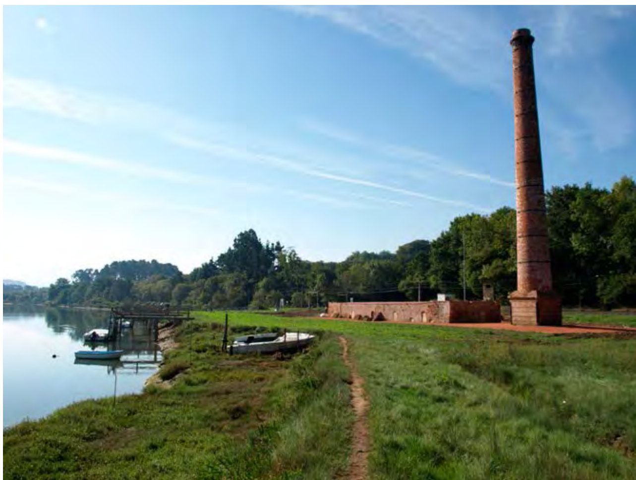
Figura 53. Tejera recuperada de Murueta.