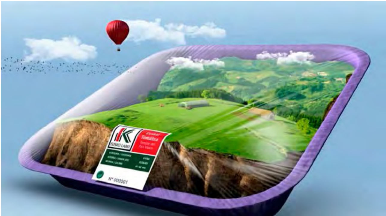
Figura 54. Imagen de la campaña saborea lo auténtico correspondiente al tomate de Gernika.

lo que podría definirse como una corriente general de patrimonialización cultural característica de nuestros días, la gestión de hábitats y su singularidad paisajística es un factor determinante en la generación de procesos de valoración cultural de elementos del paisaje.