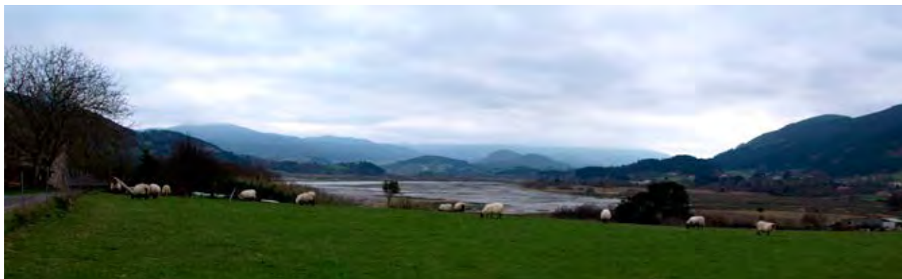
Figura 3. Caserío y ovejas en la marisma de Busturia.

Según Álvarez Munarriz (2011: 72) el concepto de paisaje cultural se convirtió en una categoría clásica cuando confluyeron los trabajos de investigadores pertenecientes a campos diferentes (antropología social, la geografía cultural y la ecología urbana), que partían de un principio que desempeñó el papel de axioma para todos los enfoques: las relaciones entre los patrones culturales y las condiciones físicas son fundamentales para comprender la existen-