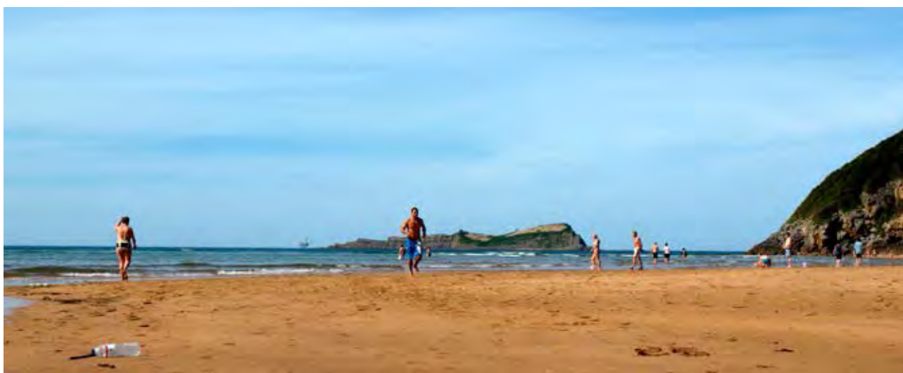
Figuras 49 y 50. Surf en la ola de Mundaka bajo una cruz en el acantilado. Bañistas y paseantes en la playa de Laida.

así como a la recuperación del valor ecológico y paisajístico desde un punto de vista conservacionista (dunas y olas), y se caracterizan por tener un carácter más lúdico y aperturista frente al mar. Cabría reseñar en este sentido, procesos de patrimonialización como el ocurrido en torno a la Ola de Mundaka a raíz de la práctica del surf , y de la celebración de pruebas del campeonato mundial de este deporte. Otra actividad en crecimiento son los paseos turísticos marinos por los alrededores del litoral, en los que se pone en valor algunos aspectos del patrimonio natural y cultural, y se recrean y generan otra perspectiva sobre los paisajes de la costa.