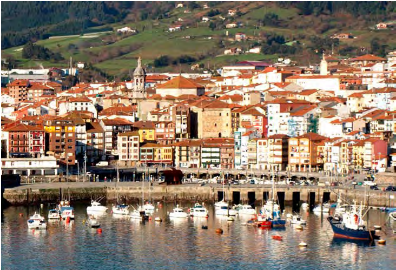
Figuras 43 y 44. Vista del puerto de Elantxobe. Casas abigarradas en el puerto de Bermeo.