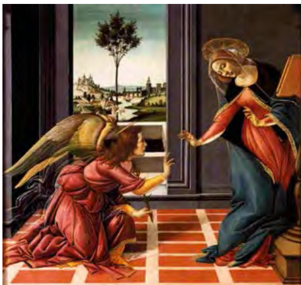
Figura 12. La ventana en la pintura Renacentista. Reproducción de La Anunciación de Sandro Botticelli.

a la que posteriormente el pensamiento ilustrado añadió una justificación racional al elaborar una visión de la naturaleza basada en un sujeto que observa, controla y domina el entorno y el medio ambiente (Cosgrove 1984).