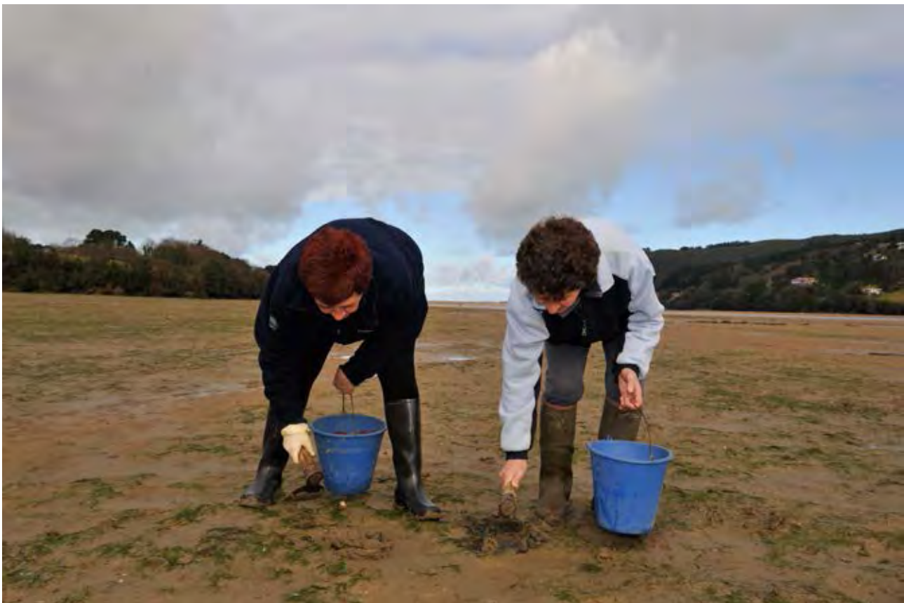
Figuras 40 y 41. Pesca en el embarcadero de Murueta. Txirleras en los arenales de Busturia.

ilustrada de la época y trata de conjugar la utilidad de la obra pública con la recuperación de tierras mediante el cultivo de las marismas, y el saneamiento de estos terrenos.