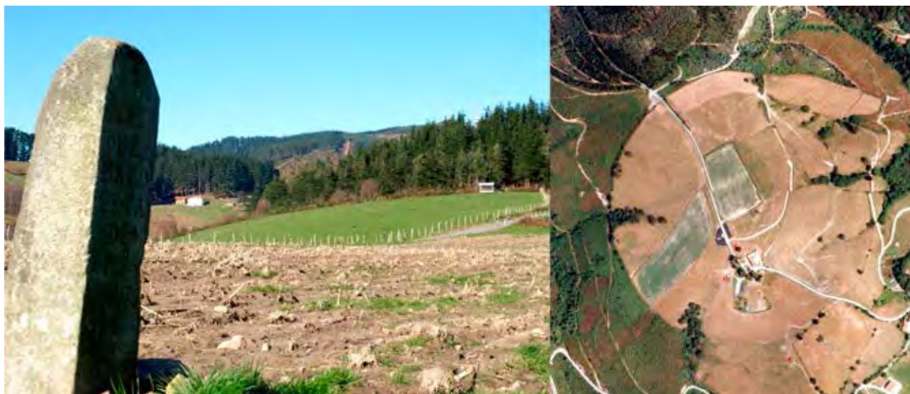
Figura 27. Mojón o kortarri, y foto aérea (2008) del sel de Makoleta en Arrieta.

cular de los seles, perceptible en la actualidad gracias a las nuevas tecnologías 56 . Su presencia es muy intensa hasta el punto de cubrir cordales enteros en forma de rosarios de círculos cotangentes. En un estudio reciente, se han inventariado en Busturialdea alrededor de 90 seles (Rementeria & Quintana 2012), distribuidos fundamentalmente en cuatro áreas específicas, situadas en torno a las cimas más sobresalientes de la comarca (Sollube, Oiz, Gastiburu-Arrola, y Leia-Bustarrigane) 57 . Básicamente se encuentran tres medidas estándar, que diferencian el sel grande o invernizo, del mediano, y del pequeño o veraniego. Esta estandarización de los tamaños parece estar correlacionada con los usos pastoriles trashumantes. Así, los seles de altura destinados a pastos de verano tienen la mitad del radio que los seles de invierno ubicados a altitudes más bajas.