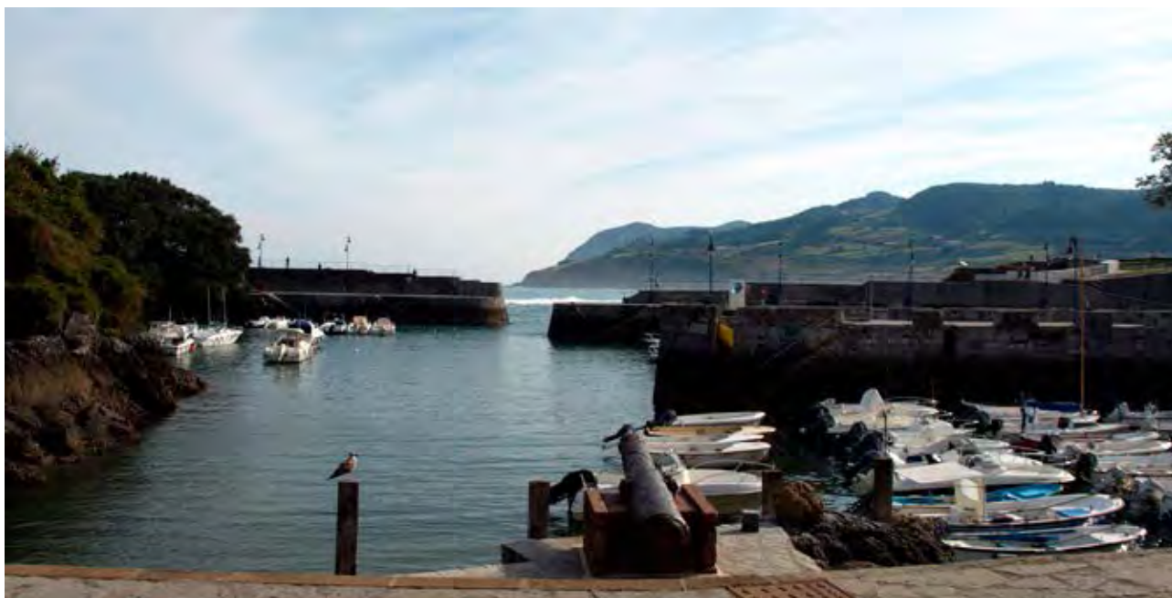
Figura 45. Cerramientos y cañón en el puerto de Mundaka.

Los núcleos de población costeros mantienen en gran medida ese característico urbanismo que Txomin Agirre describiera en su obra Kresala (1906), como el típico pueblo de pescadores 105 , caracterizado por su ubicación al abrigo de algún cabo natural, su orientación de cara al mar, la escasez de espacio, sus calles estrechas y empinadas, y el estilo peculiar de las casas de pescadores, estrechas, amontonadas y coloridas, en contraste con el hábitat disperso de la campiña. Otro elemento urbanístico importante en estas comunidades son los astilleros, la lonja y las industrias de transformación de los recursos del mar. Es un paisaje de olores a salitre y pescado.