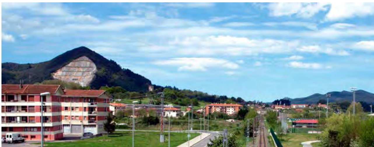
Foto 36. Infraestructuras viarias y urbanas, y el paisaje extractivo de la cantera de Forua.

llidos y casas del País Vasco, al menos desde el siglo XVI, como representación simbólica y descripción de los paisajes en los que se ubicaban, que crea un vínculo entre el paisaje pasado y el paisaje presente, y nos remite a una estrecha relación histórica entre la identidad de la población y el territorio.