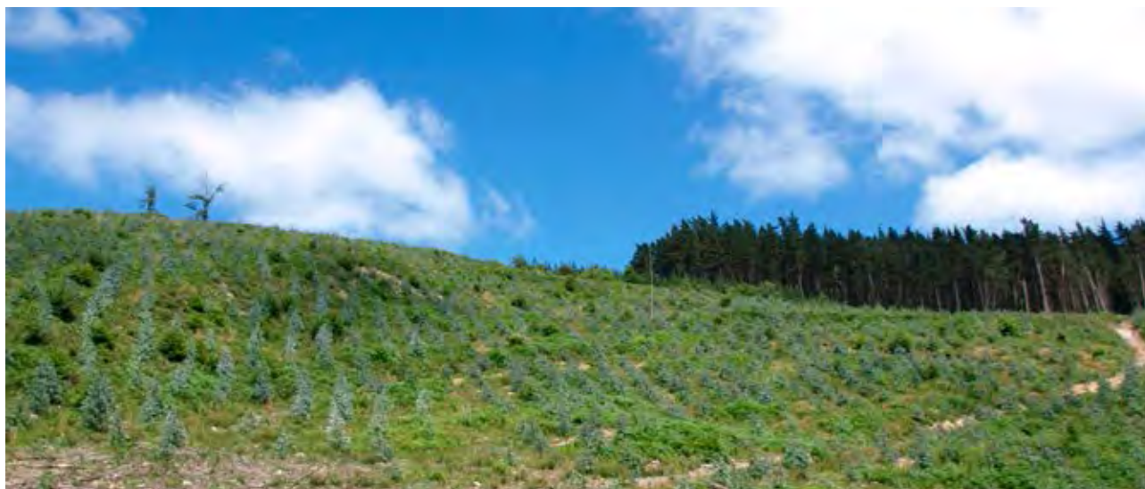
Figura 29. Plantación reciente de eucalipto en las laderas de Bastazar (Arratzu, 2011).

En el primer cuarto de siglo dos grandes capitalistas, Sota en la margen izquierda y Gandarias en el interior, fueron quienes primero plantaron en sus propiedades, antes de la contienda civil. Pinares que, mientras iban creciendo también eran empleados por los caseríos del entorno, para obtener broza. Hacia 1945, al ver el precio que obtenía la madera del pino las plantaciones se generalizaron y se utilizaron también las zonas de castañares y robledales bajando hasta los frutales, campos cultivados, prados e incluso huertas.