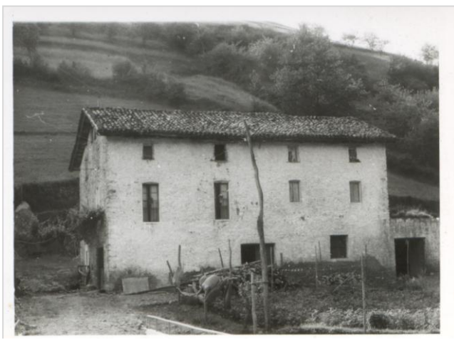
JM Barandiaranen jaiotetxea. Peruenezar. Ataun